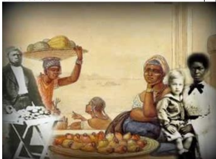
Imagem 3. Mulher e trabalho no século XIX: a vida dentro de casa

http://www.brasilecola.com/historiab/formas-trabalho-escravo-no-brasil.htm