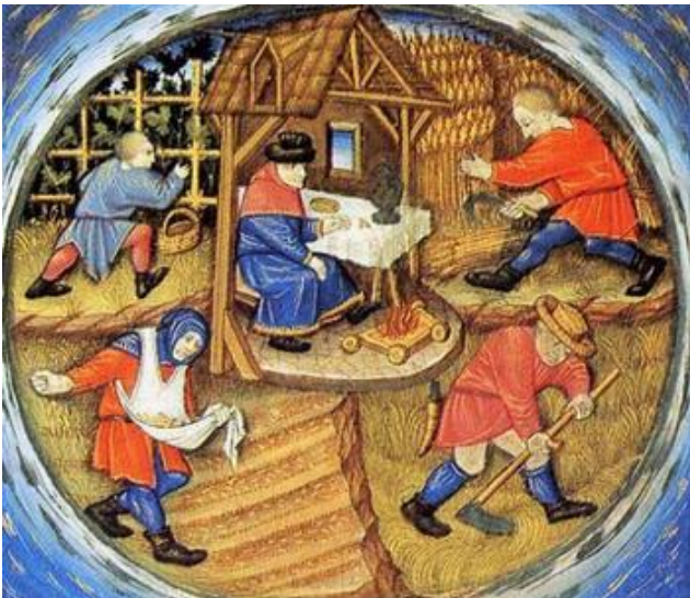
Imagem 5. Trabalho na Europa Medieval

http://ofrioquevemdosol.blogspot.com.br/2010/03/o-que-de-fato-move-o-pendulo-climatico.html