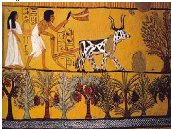
Imagem 1. Trabalho no Egito Antigo

http://teiadofatos.blogspot.com.br/2012/02/egito-antigo-dadiva-do-nilo.html