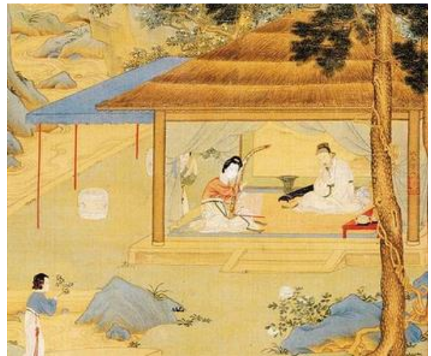
Imagem 6. Trabalho na Ásia Oriental Medieval

http://oridesmjr.blogspot.com.br/2013/05/os-grandes-imperios-medievais-da-asia.html