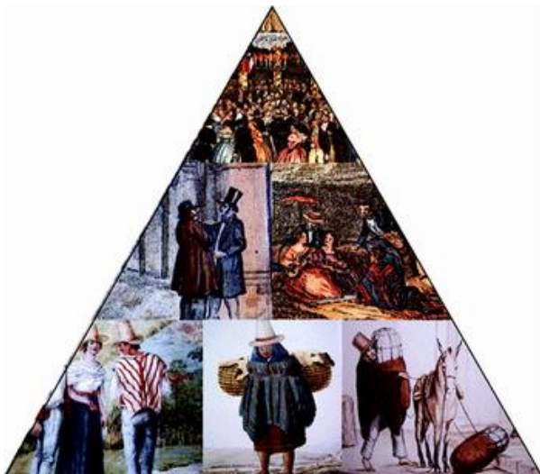
Imagem 7. Trabalho na América espanhola

http://portifoliovirtuaisalesiano.blogspot.com.br/2012/09/2008-revisao-para-prova.html